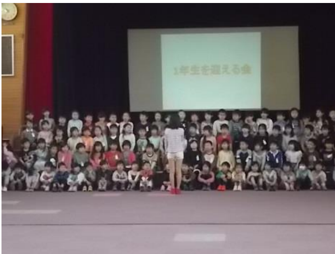
1年生を迎える会の様子