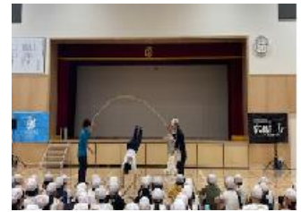
CHIMERA スクールキャラバン

先日、1年生の教室に行くと、課題が早く終わったちょっとした時間を使ってゲームをしていました。子供たちが、わくわくした気持ちになっているのが伝わってきました。最後に担任教師が「今日は、協力するゲームをしました。」と話すと、「協力するって楽しいな。」と感じている様子でした。5年生は、4月26日に CHIMERA スクールキャラバンの方々にご来校いただき、どんな願いでこの活動をしているのか、ダンス等を始めた年齢やきっかけのお話を伺いました。そして、パフォーマーの方々にダンスやダブルダッチを見せていただき子供たちも体験しました。また、建築家・デザイナーの方を講師に廃材を使ったアート体験をしました。新しいことに取り組み、自分のよさを再発見したり、友達と協力して完成させたりする体験をし、子供たちは真剣な表情や笑顔をたくさん見せていました。ただ漫然と活動させるのではなく、目的や願いを伝え、子供たちにとって価値ある体験となるようにしていきます。